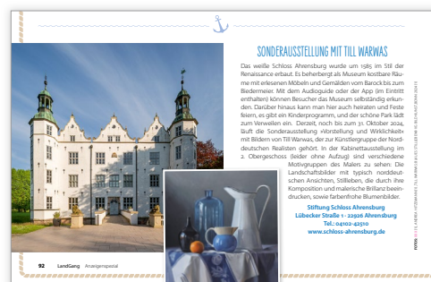
1/2 Seite quer