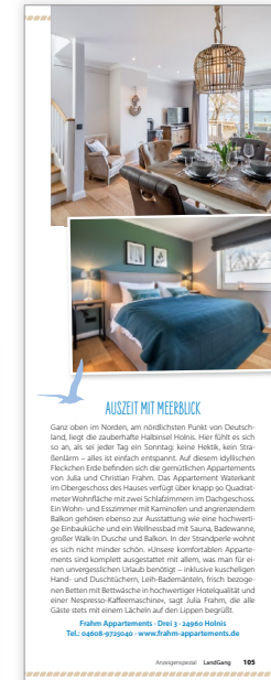
1/2 Seite hoch