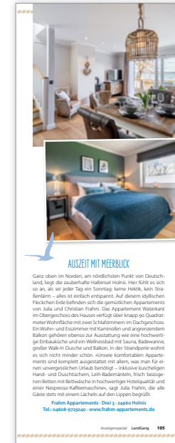
1/2 Seite hoch