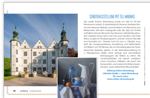
1/2 Seite quer